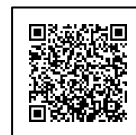
[申請マニュアル] 授業料軽減助成金ページ